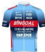
BINGOAL CASINO CHEVALMEIRE VAN EYCK