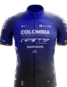
COLOMBIA TIERRA DE ATLETAS