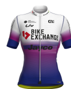
BIKE EXCHANGE JAYCO