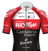
RIO MIERA CANTABRIA DEPORTE