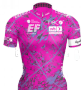
EF EDUCATION TIBCO- SVC