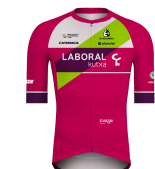
LABORAL KUTXA FUNDACIÓN EUSKADI