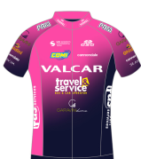
VALCAR TRAVEL & SERVICE