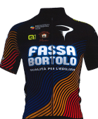
TOP GIRLS FASSA BORTOLO