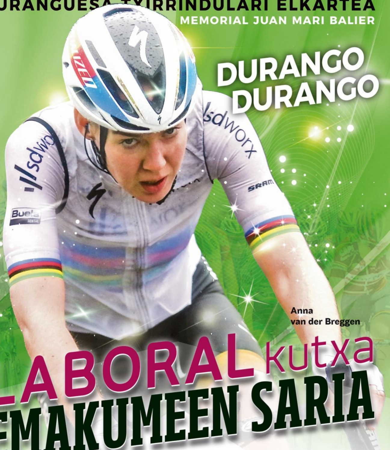
Anna van der Breggen