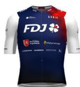
FDJ NOUVELLE AQUITAINE FUTUROSCOPE