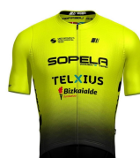
SOPELA WOMENS TEAM