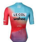
LE COL - WAHOO