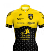
STADE ROCHELAIS CHARENTE MARITIME