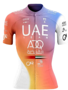
UAE TEAM ADQ