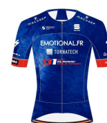
EMOTIONAL FR TORNATECH GSC BLAGNAC